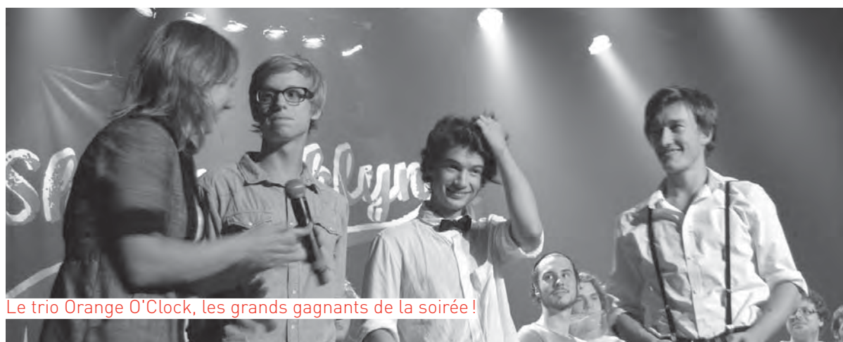
Le trio Orange O'Clock, les grands gagnants de la soirée!

Impliquez-vous! Vous êtes tous et toutes les bienvenus!