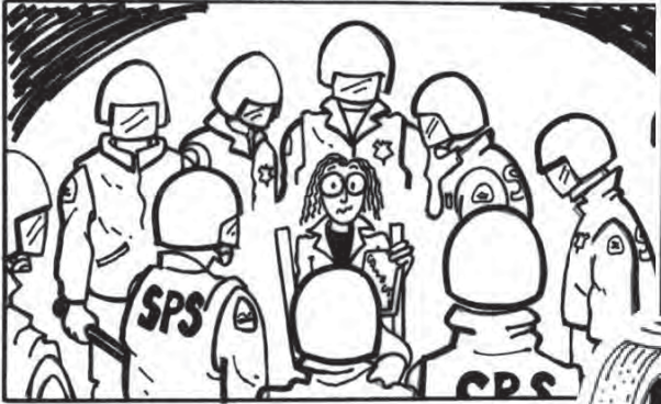
TECHNIQUES ET BAVURES POLICIÈRES À SHERBROOKE