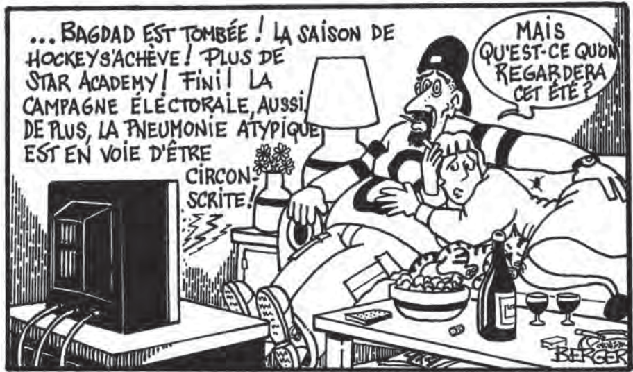
« cet été ? » « Entrée Libre, s'est mérité le prix. Caricature des médias écrits communau- »

... BAGDAD EST TOMBÉE ! LA SAISON DE HOCKEY S'ACHÈVE ! PLUS DE STAR ACADEMY ! FINI ! LA CAMPAGNE ÉLECTORALE, AUSSI. DE PLUS, LA PNEUMONIE ATYPIQUE EST EN VOIE D'ÊTRE CIRCONSCRITE !