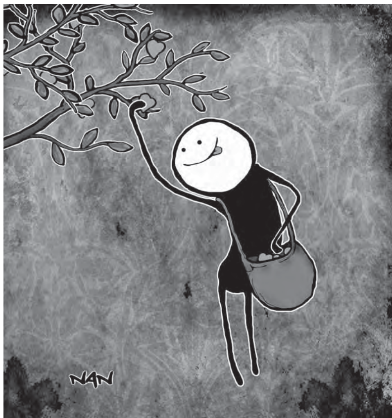
Illustration : Nan

12 septembre. Assemblée Générale Annuelle d'Entrée Libre : À cette occasion, tous sont invités à participer au Bilan annuel, à l'élection du nouveau Conseil d'administration et à la préparation du plan d'action de l'année prochaine. 2012 sera une période de grands bouleversements. Projets de consolidation et d'expansion au menu. Venez participer au succès du Journal! Il est à noter que tous peuvent proposer leur candidature au Conseil d'Administration. 740 rue Cambrai, Sherbrooke, 12 septembre 2011, 18h.