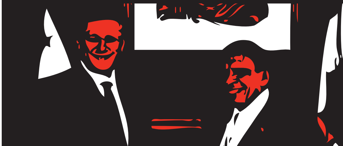
Illustration : Étienne Ménard