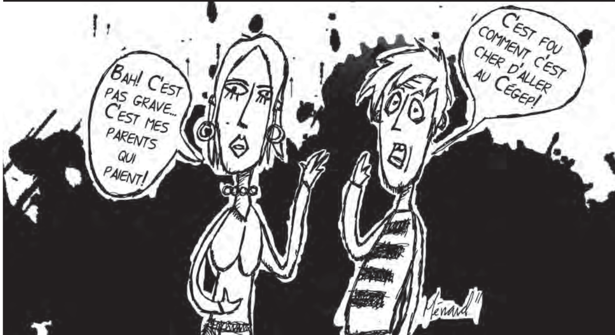
Illustration : Etienne Ménard

22 octobre. Halloween en famille : Différentes activités sont possibles pour fêter Halloween avec nous cette année! On se déguise en détective ou en tout autre personnage pour venir jouer à un jeu spécial intitulé Clue Géant. Rencontrez des personnages vivants et trouvez la clé de l'énigme. Également, un atelier de décoration de citrouilles et de maquillage. Du plaisir pour toute la famille! Rendez-vous à la Maison de la famille au 72, rue Victoria. Apportez vos citrouilles! Coût : à venir. Inscription par téléphone (819) 791-4142 ou par courriel : phamel@maisonfamillesherbrooke.com